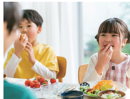
▲写真はイメージです

「食べる時間が短い」という声を受け、準備や片付けとは別に20分以上の食事時間確保や、他都市の工夫を取り入れた改善を各学校へ求めていきます。